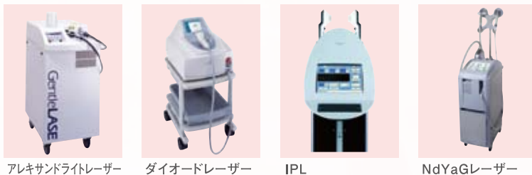
アレキサンドライトレーザー

全てクリニックでしか扱うことのできない医療用レーザーを毛質、肌質に応じて使い分けることにより最高の脱毛効果が期待できます。これだけの医療脱毛環境が整っているのは道内では当院のみ。