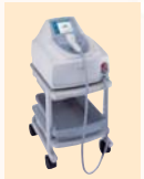
ダイオードレーザー