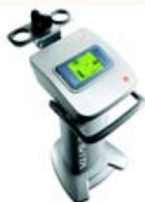
キャビテーション発生機器 KAVITA

当院では破壊して融解した脂肪を早く体外に排出させるのに有効なRF治療を組み合わせているので治療効果は非常に高いです。