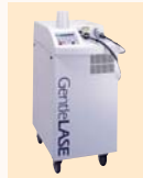
アレキサンドライトレーザー

全てクリニックでしか扱うことのできない医療用レーザーを毛質、肌質に応じて使い分けることにより最高の脱毛効果が期待できます。これだけの医療脱毛環境が整っているのは道内では当院のみ。